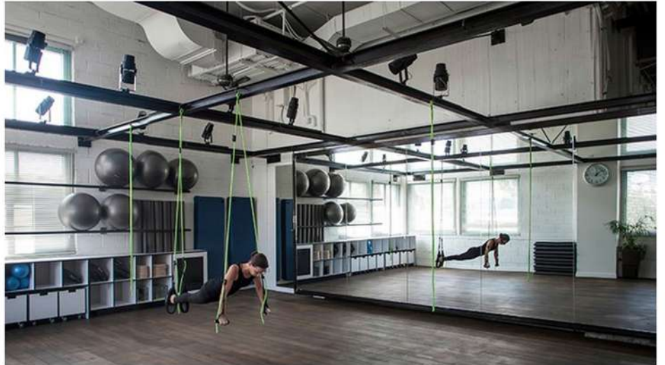
מבט אל קונסטרקציית הברזל שתוכננה בכדי לאפשר ריחוף בכוח הגוף בחלל