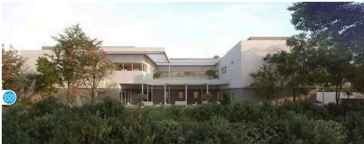
יש רק 17 מקלטים בארץ. רק שניים מהם תוכננו מהיסוד למטרה זו (הדמיה: סטודיו אייקו)

במחקר מ-1984 שערך רוג'ר אולריך, פרופ' לארכיטקטורה משוודיה, הוא בחן את השפעתם של מבני בתי החולים על מאושפזים ומטופלים. הוא גילה כי אלה שזכו לחדרים המשקיפים אל נוף טבעי החלימו מהר יותר מחולים שאושפזו בחדרים עם קירות לבנים ללא נוף. המחקר היווה אבן דרך למתכננים ולמעצבים, בייחוד כאלה העוסקים באוכלוסיות בטיפול או בשיקום. כך גם בנוגע לנשים שיצאו מביתן בשל אלימות קשה ומתמשכת שחוו במקום שהיה אמור להיות מבצרן הבטוח.