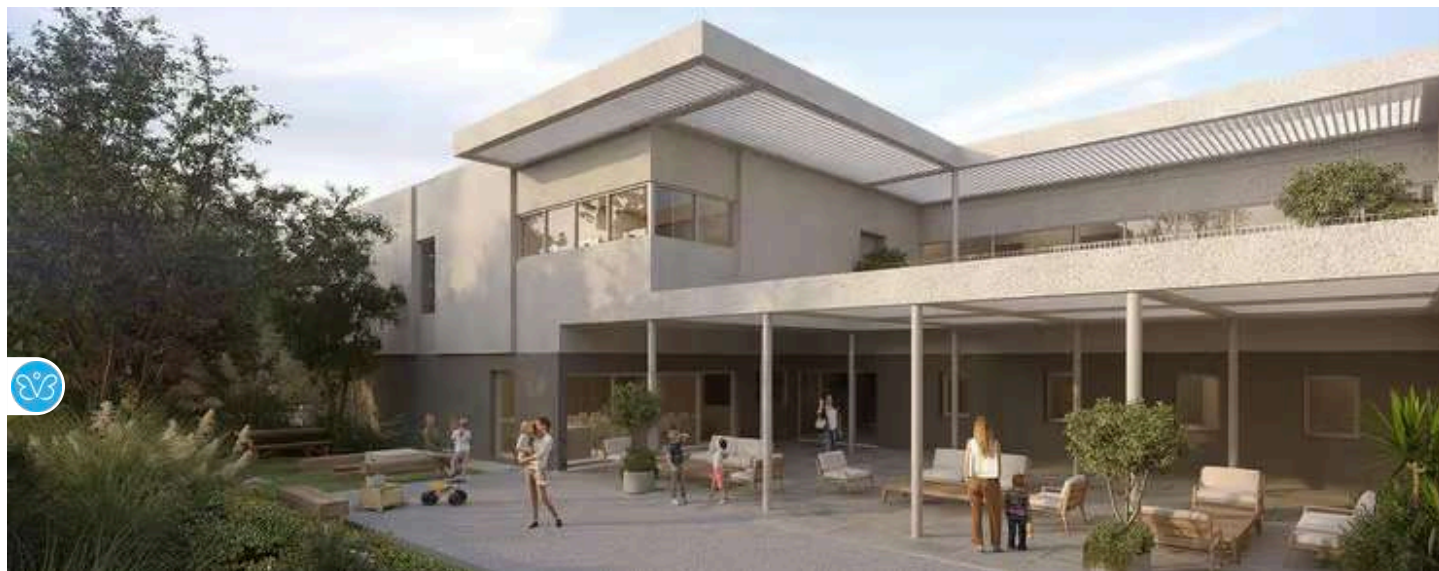
חצר פנימית מוגנת, מלאה בצמחייה ובמתקני משחק (הדמיה: סטודיו אייקו)