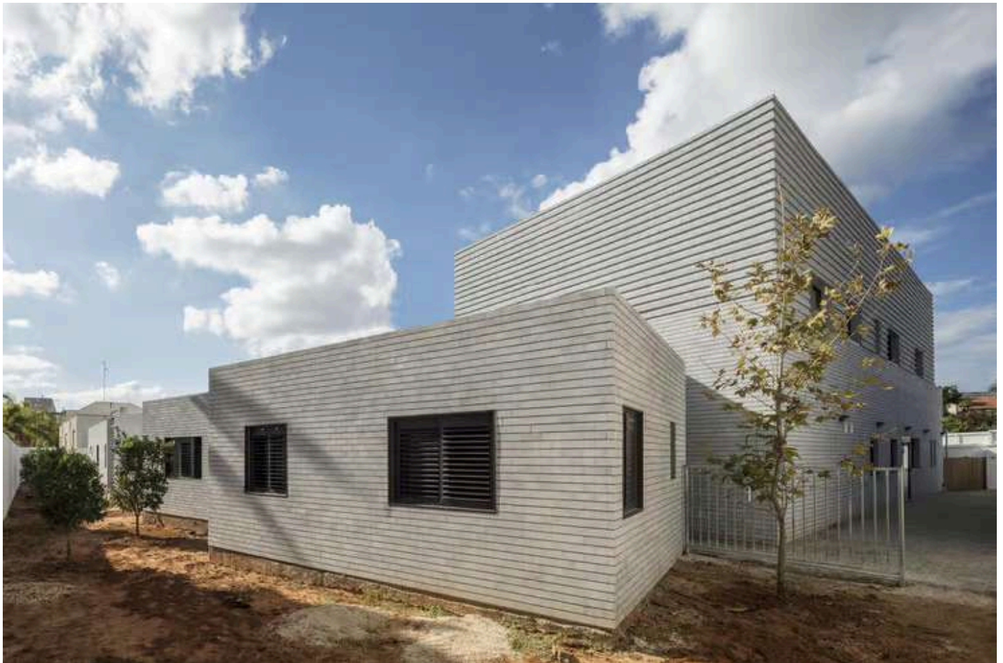
המעון הראשון לנשים מוכות בתכנון יעקבס-יניב אדריכלים ועמוס גולדרייך

על המקלט הראשון, שבנייתו הושלמה ב-2016, זכה המשרד בפרס הבינלאומי הנחשב WAF – World Architecture Festival – בקטגוריית "מבנה הבריאות העתידי", בשל יתרונות העיצוב המובהקים שמיקדו את אותן נשים "ביום שאחרי", תוך שהן לומדות כיצד לבנות את חייהן מחדש. "מבחינתנו זו חוויה עוצמתית ותחושה שאנחנו מצליחים לעשות טוב בעולם של שפע ומותרות. התפיסה שלנו היא שמבנים מוסדיים יכולים בהחלט להיות ברמה אדריכלית גבוהה ולסייע בשיפור איכות החיים של מי שגר בו".