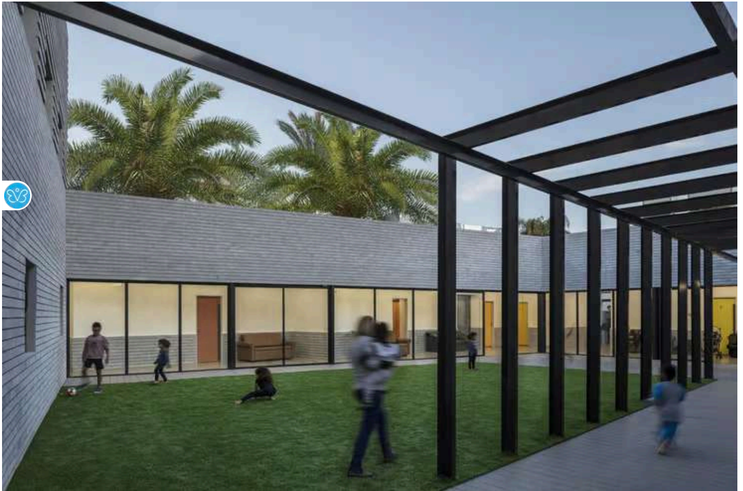
זכה בפרס הבינלאומי World Architecture Festival בקטגוריית "מבנה הבריאות העתידי"

לדברי יעקבס, הטקטיקות העיקריות שבהן נעזרו בבואם לתכנן את המקלט החדש שמאוכלס בחודשים האחרונים – ובדומה למקלט הקודם שתכננו – היו הכנסת שפע של אור טבעי, דרך תכנון חצר פנימית מוגנת ומזמינה, ובה מתקני משחק וצמחייה רבה.