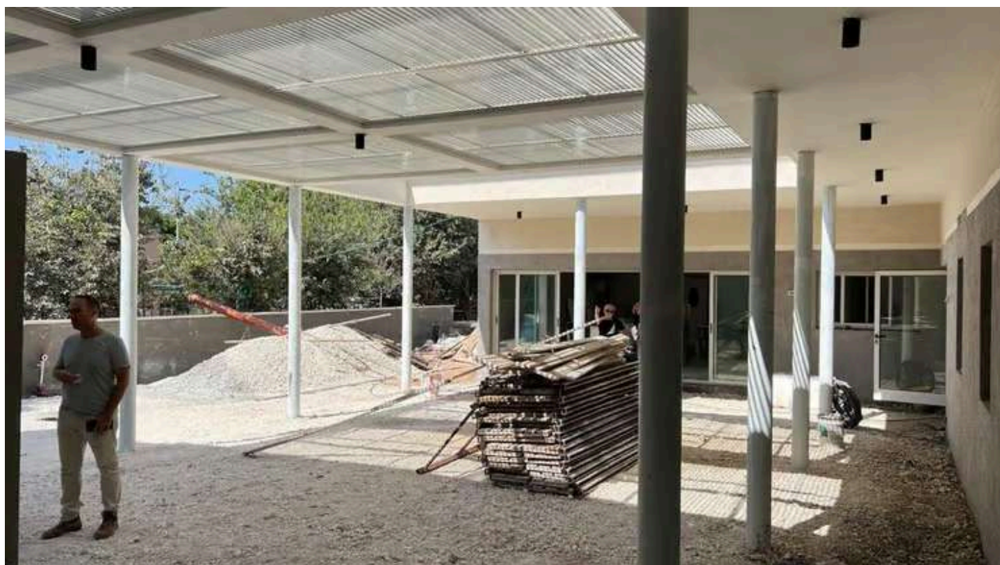
כך זה נראה במהלך הבנייה. האכלוס נעשה תוך כדי המלחמה