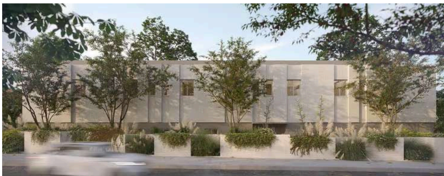
בית זמני למשפחות חלקיות, שבראשן אמה, שנועד לספק תחושת ביטחון ונינוחות (הדמיה: סטודיו אייקו)