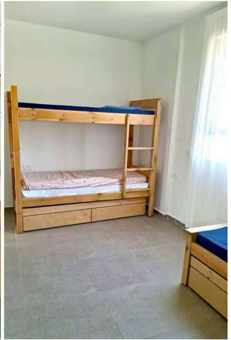
חדרים צנועים המאופיינים בחומרים חמים וטבעיים. בעתיד מקווים להמשיך את עיצוב הפנים